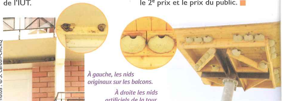
À gauche, les nids originaux sur les balcons.