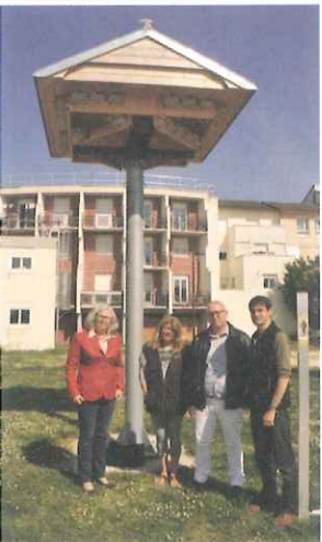
...devant la « Tour à hirondelles ».